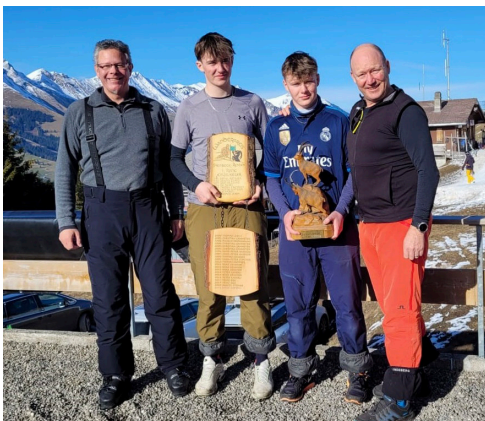
Das Siegerteam 1 der BSR

Platz 1 ging an Team 1 der Berg- und Skiriege!