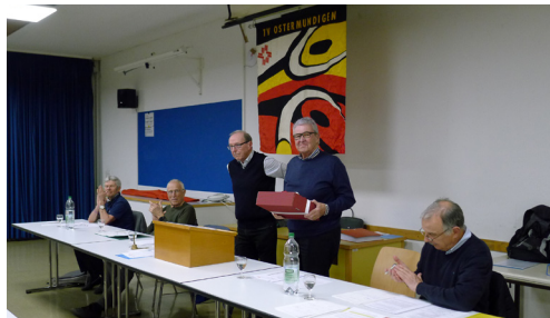
Der geehrte Kassier