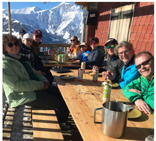
Ansicht auf der Veranda