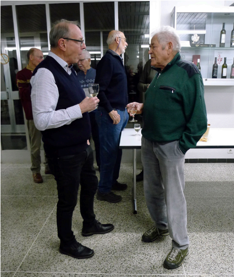
Beim Nachtessen mit Fleischvogel