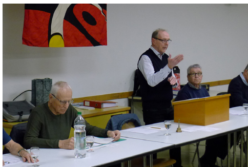
Der Obmann führt souverän durch die HV

Die traktandierten Geschäfte wie Jahresbericht 2023 des Obmanns, Rechnung 2023 und Budget 2024 wurden ohne Einwände genehmigt. Der Mitgliederbestand der Männerriege beträgt per Ende Jahr 75 Personen. Erfreulicherweise gab es weder Austritte noch Todesfälle aber leider auch keinen Neueintritt.