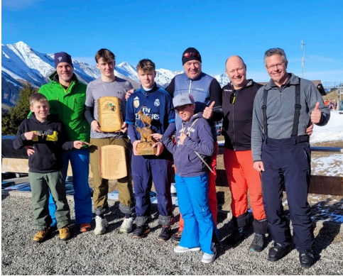
Die beiden BSR Teams vereint