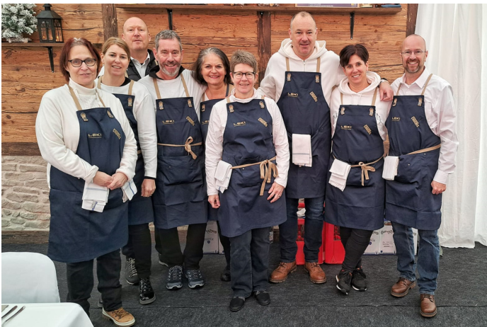
Das BSR VIP Helferteam in Vollmontur.