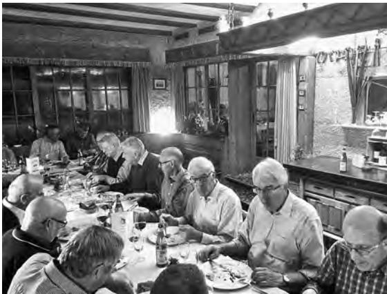
Die Küche vom National liess keine Wünsche offen