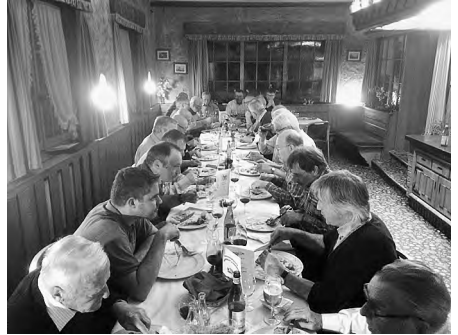
Das Bankett hat sehr geschmeckt und es wurde angeregt diskutiert