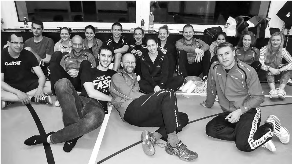
Die Putztruppe nach getaner Arbeit