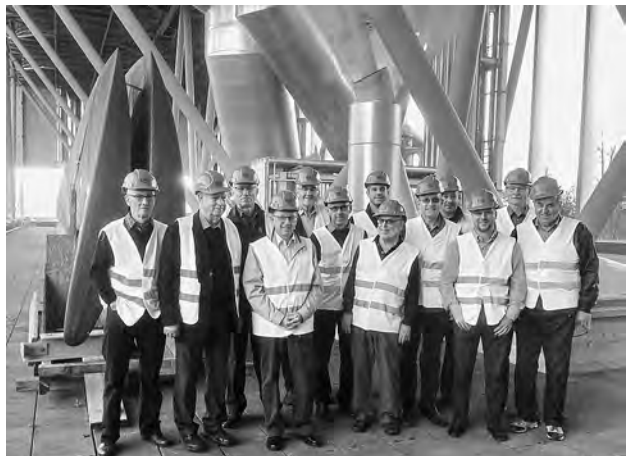
Die voll ausgerüsteten Ehrenmitglieder im Gruppenfoto

Es war für die teilnehmende TVO Truppe ein sehr interessanter Nachmittag!