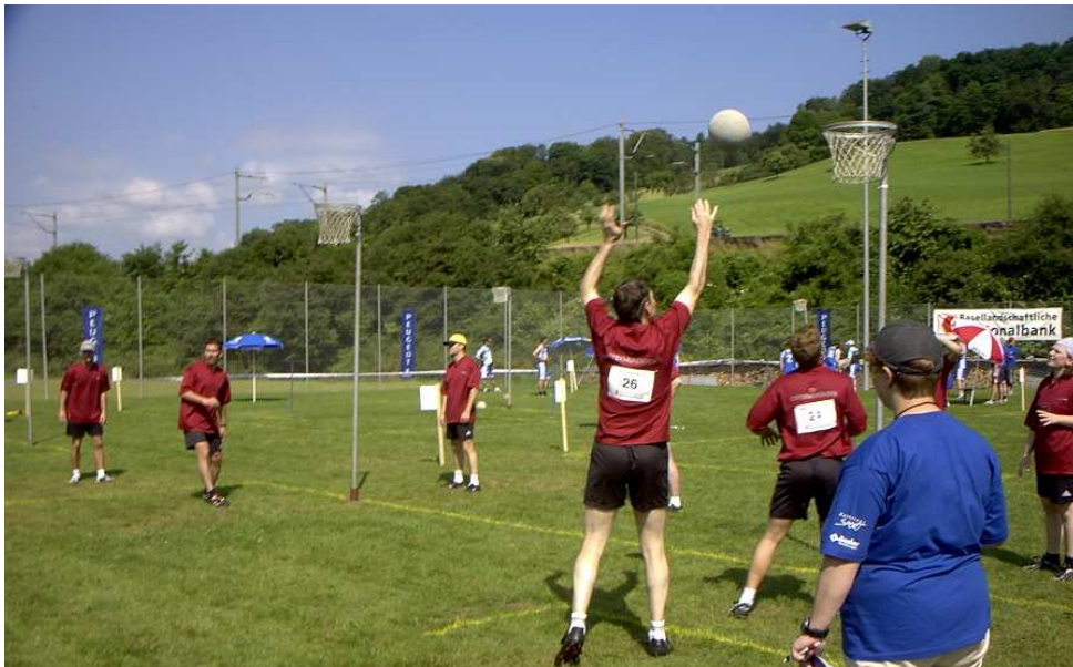
Die TVO-Korbballer in Aktion.