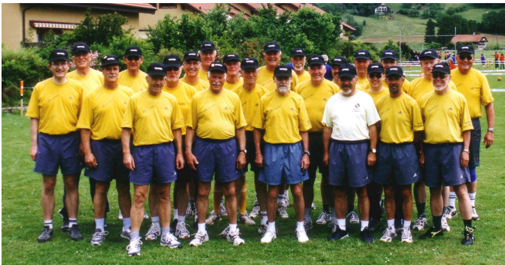
Gruppenbild der 24 Turner in Toffen.