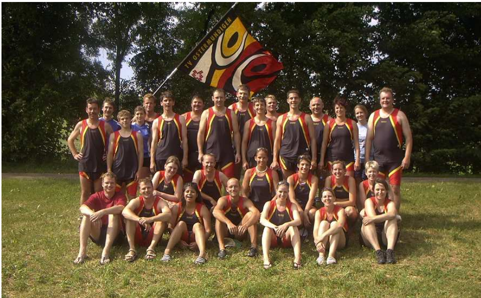
Gruppenbild unserer Aktivriege mit der TVO-Fahne.