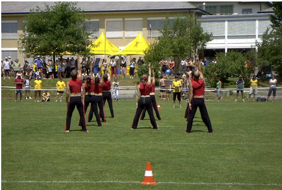
Die Kleinfeldgymnastiker mit perfekter Haltung.