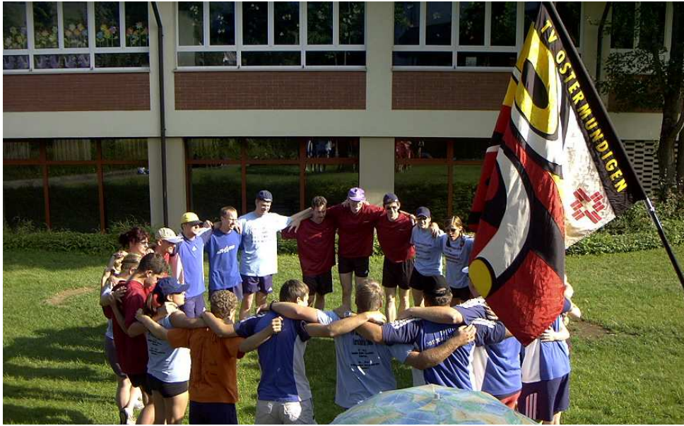
Volle Konzentration auf den Wettkampf.