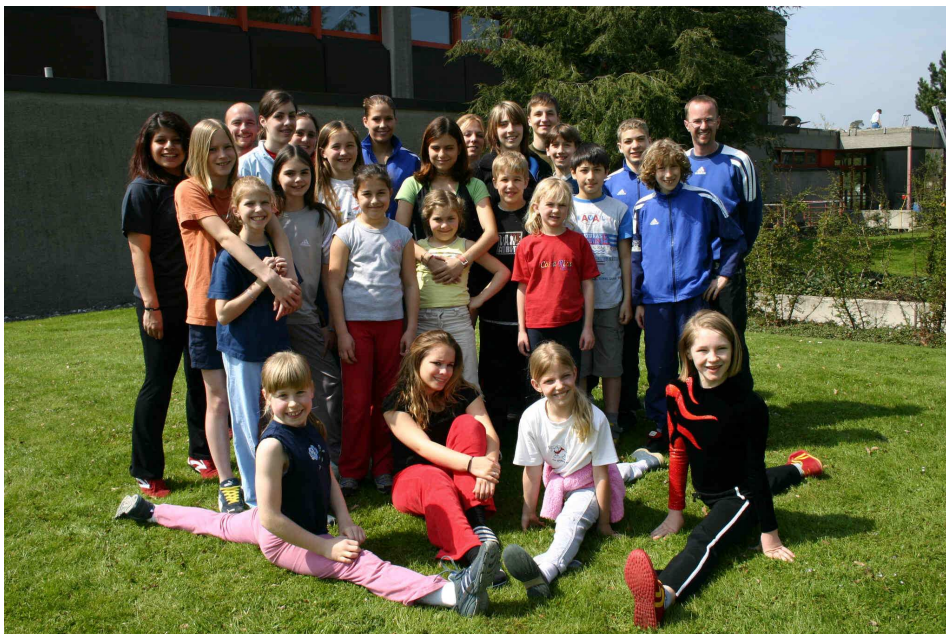
Die 27-köpfige Jugendlagertruppe beim Gruppenbild 2005