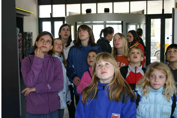
Gespannte Erwartungen der Gruppe beim Ausflug ans Verkehrshaus Luzern.