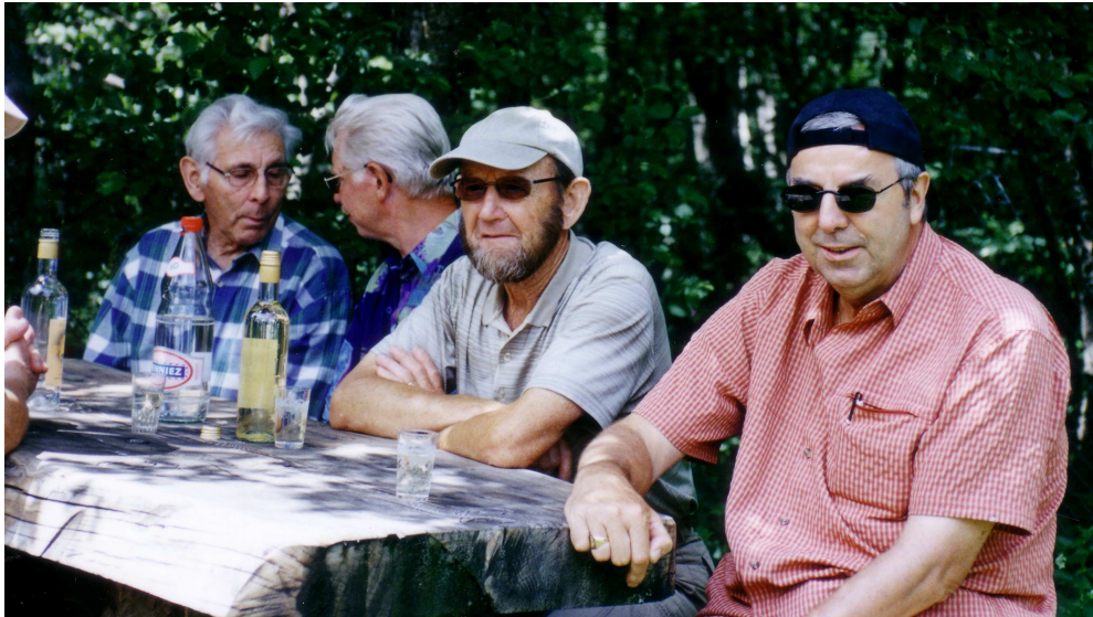
Beim Apéro am letzten Tag.