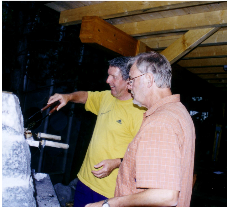
Grillmeister am Werk.