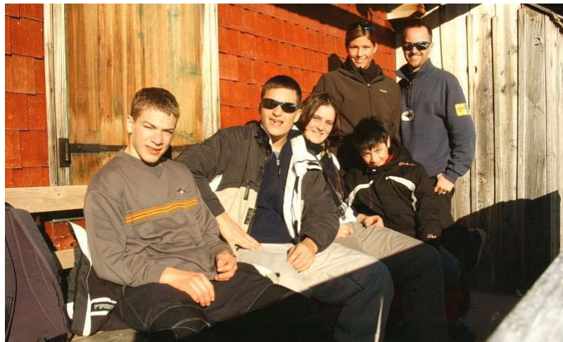
Die kleine Schar der Teilnehmenden am Ski-Weekend auf der Metschalp