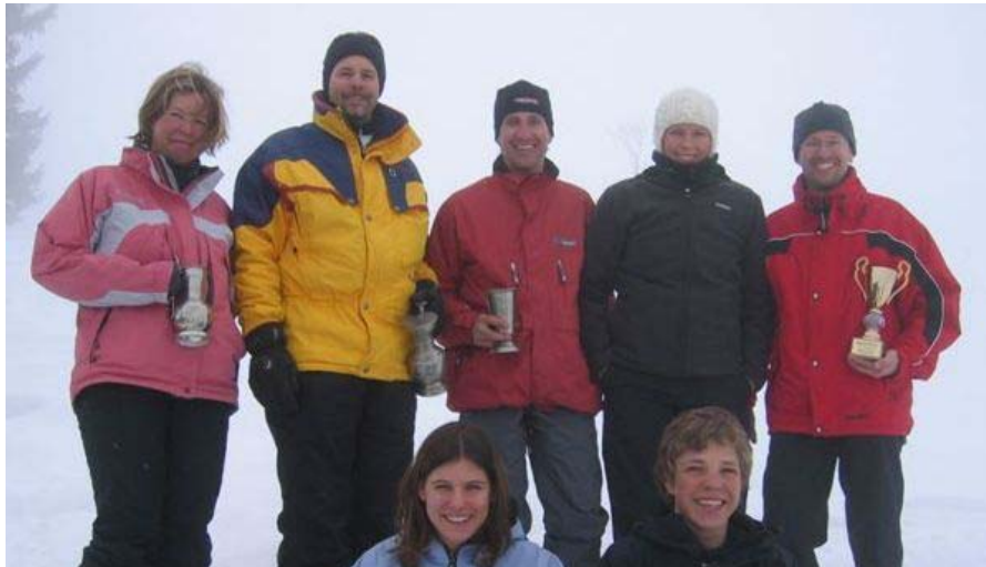
TVO Hüttenrennen 2005: Das Siegerbild