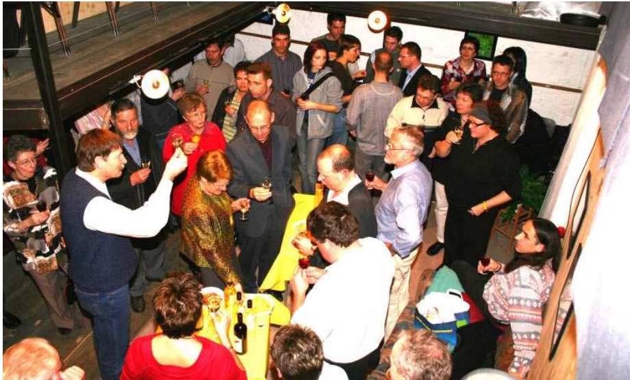
Die TVO Schar nach der Vorstellung beim Apéro