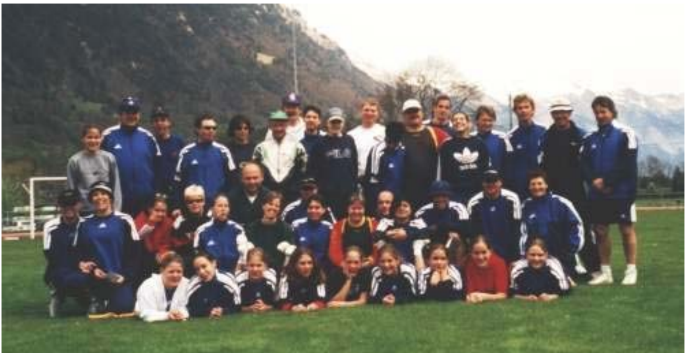
Gruppenbild aus dem Trainingsweekend in Interlaken

Vereinswettkampf Aktive 3-teilig, 1. Stärkeklasse, so waren wir angemeldet und auch gestartet. Mit 36 Einsätzen pro Wettkampfsteil und einer Gesamtnote von 25.96 erreichten wir in der obersten Stärkeklasse den 11. Rang. Bei strahlend schönem Wetter vermochten die Disziplinen Wurf, Note 9.22, Gymnastikkleinfeld