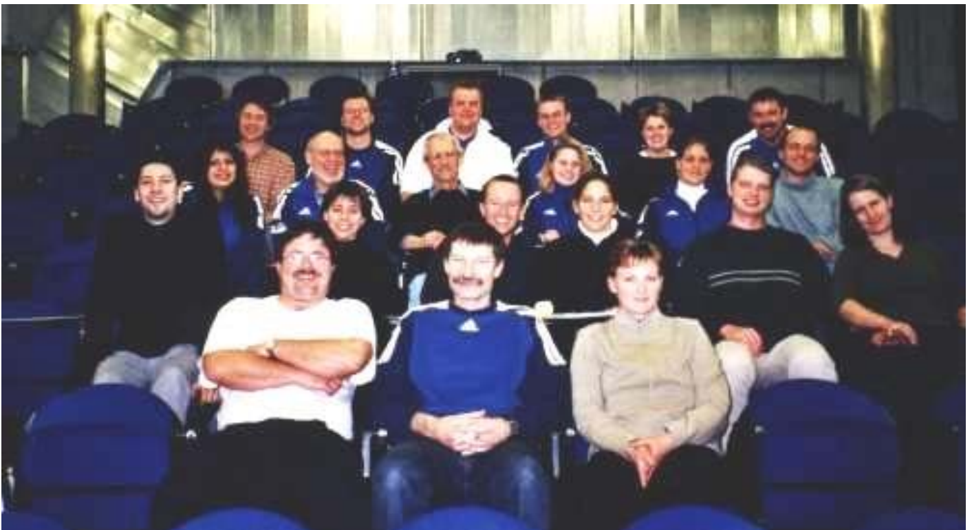
Das TVO Workshop Team beim abschliessenden Gruppenbild.

Besuch von zwei Turnfesten, Kantonalmeisterschaft, Trainingsweekend, Jugendlager, Jugitag, Unterhaltungsabend, Jahresmeisterschaft Sommer- und Winterplauschprogramm, Korbball-Meisterschaft, Spieltag, Kurse, Plauschturniere, Turnfahrt, Lotto, SNWK, Herbstmärit, Elternabend, öffentliches Training, TBM-Anlass.