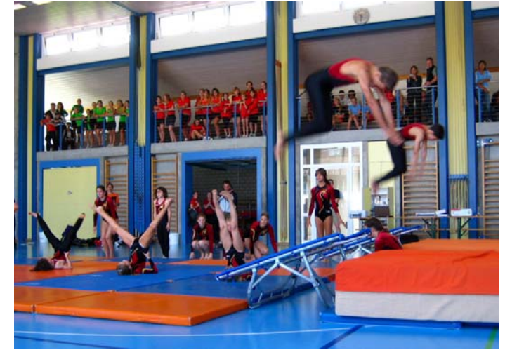
Die Geräteturner zeigten eine gute Gerätekombination.

Unsere Jugeler mit ihren Leitern am Jugitag 2010