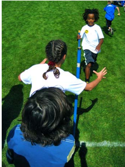
Das Unterstufe-Team war auch schnell unterwegs ...

Nach dem dritten Wettkampfteil starteten wir mit zwei Mannschaften bei der Pendelstafette. Das Oberstufe-Team war schnell unterwegs. Leider hatten sie einen Stabfehler oder der Stab wurde nicht im richtigen Moment losgelassen und dazu wurden auch noch unsere Bahnnachbarn in unser Team integriert. Deshalb reichte es nicht auf das Podest. Das Unterstufe-Team war auch schnell, aber für den ersten Platz hatten wir 6 Sekunden zuviel gebraucht. Nach der Pendelstafette durften wir noch freie Vorführungen bestaunen. Unser VGT-Team zeigte eine sehr schöne Vorstellung. So gut habe ich sie noch nie gesehen!