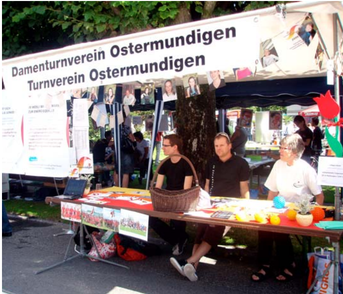
Ruhige Phase am gemeinsamen Infostand von TV und DTV