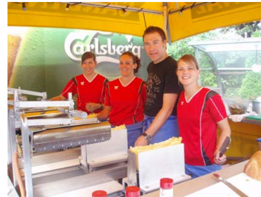
Das fröhliche Raclette Team ...

Unsere bewährte Herbstmärit Beiz mit Kaffee, Kuchen und Raclette