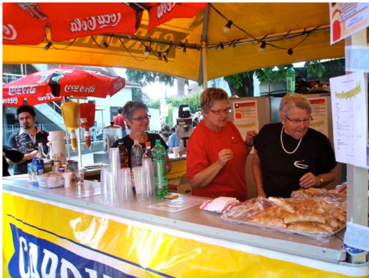
Nicht nur beim Schminken hatte der DTVO alle Hände voll zu tun.