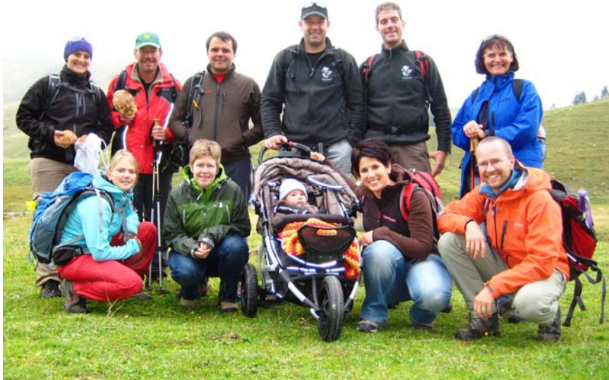
Das schöne Gruppenfoto der Bergturnfahrt Teilnehmenden mit „Kind und Kegel“