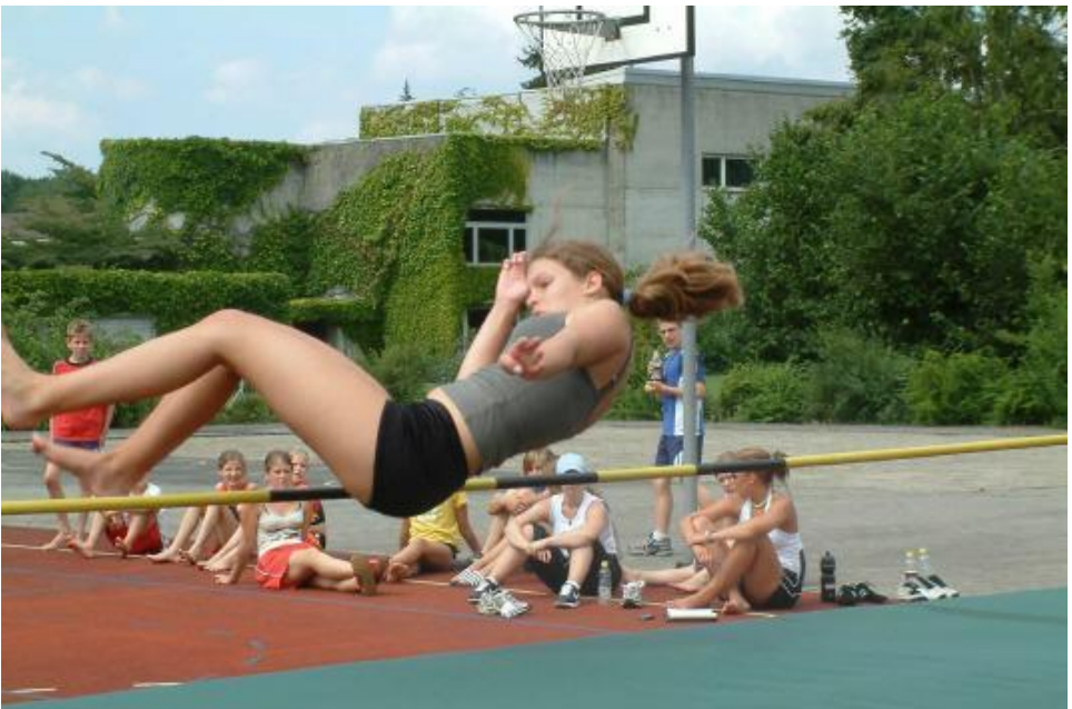
Für einmal Hochsprung für alle!