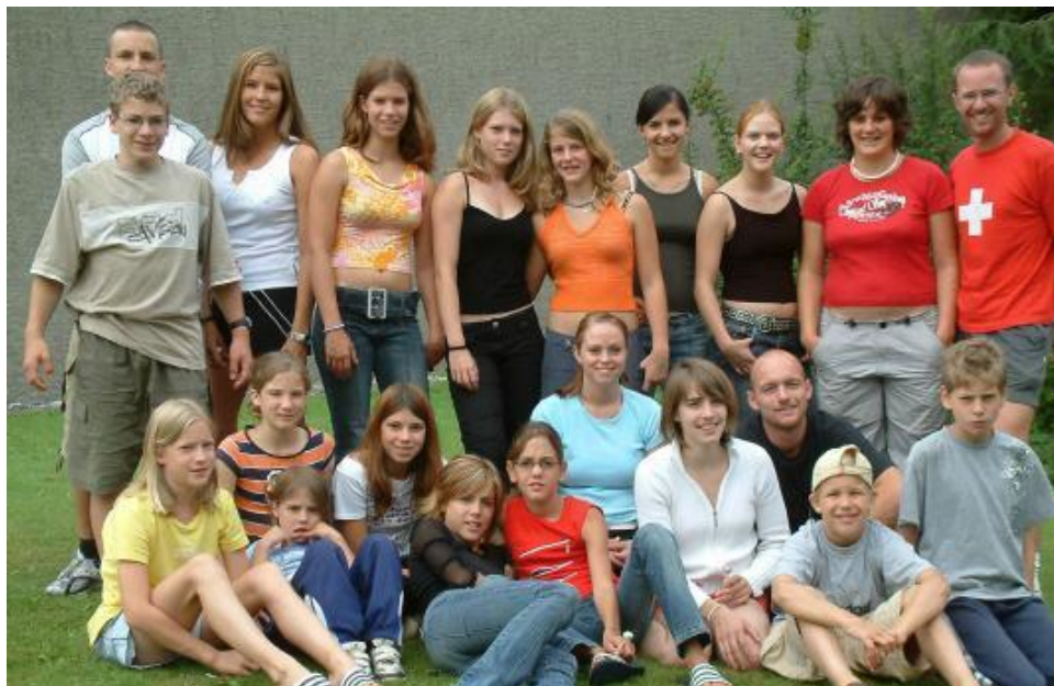
Die Teilnehmerinnen und Teilnehmer sowie die Leiter des JULA 04.