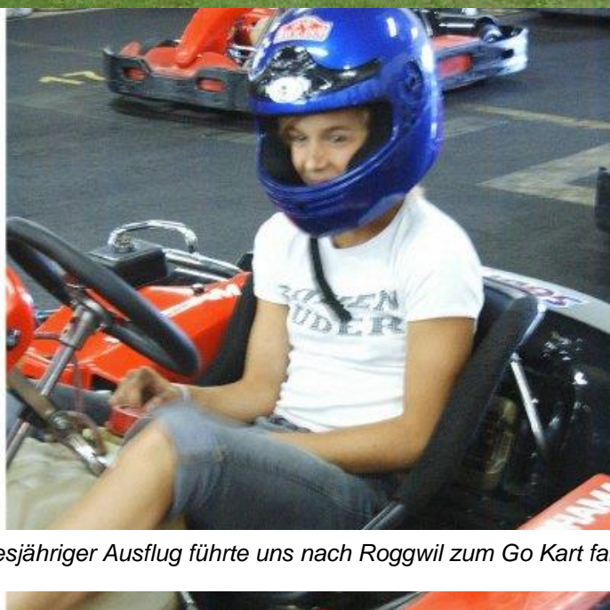
Der diesjähriger Ausflug führte uns nach Roggwil zum Go Kart fahren.