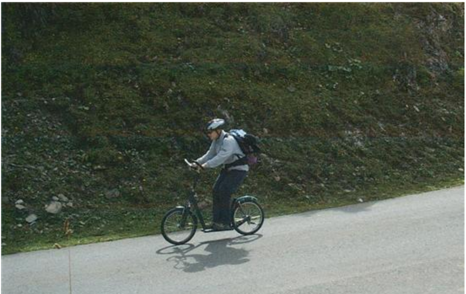
Sylvia in voller Fahrt