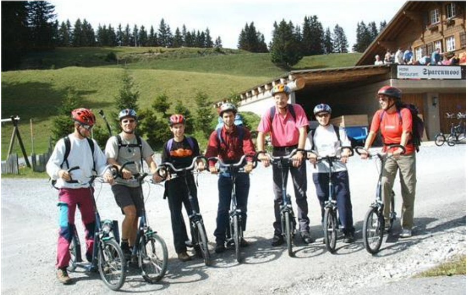
Alle bereit zum "trottinette"